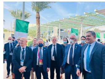
Toti in Dubai

Come risposta Toti intimava al Comune di Albenga, minacciando querele, di togliere dalla pagina Facebook lo slogan della manifestazione: "senza Pronto soccorso si muore". Dopo che Gino Rapa, anima dei "Fieui di caruggi", era stato bannato dalla pagina social della Regione, l'operazione comunicativa totiana proseguiva in puro spirito democratico (?) dal Boat Show di Dubai: "è tutta una strumentalizzazione inaccettabile e disinformazione che fanno le istituzioni e le forze politiche nei confronti dei cittadini", "la manifestazione per chiedere la riapertura del pronto soccorso si basa su idee fuorvianti...sindaci e comitati si battono per cose irrazionali...Questo è egoismo non solidarietà..."